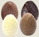
Mini œufs Lait, Noir, Caramel et Blanc (24 unités)