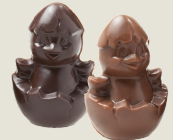
Mini Caliméro (6 unités)