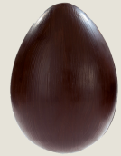
Œuf brossé Noir garni (23 cm)