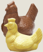
Poule Lait garnie (18 cm)