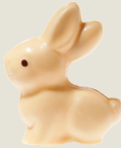
Lapin Blanc garni (12 cm)