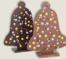
Cloche sur pied (20 x 16 cm)